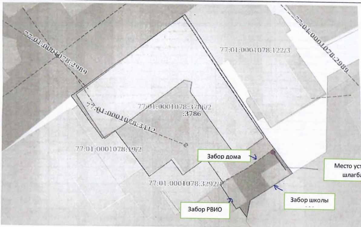
СХЕМА УСТАНОВКИ ШЛАГБАУМА